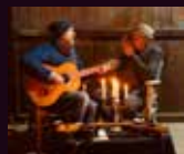
20:30 Uhr: Frittenknaller

Aus der Begeisterung zur legendären Disco Musik der 70er hat sich Dr.G. And the Disco Divas formiert. Die 11-köpfige Band bringt den unverwechselbaren Sound aus der Blütezeit der Disco Musik auf die Bühne. Neben Gesang, Gitarre, Bass und Schlagzeug komplettiert die Band die typische Instrumentierung der Disco-Musik mit Keyboard, Trompete, Posaune, Saxophon und Percussion. Mitgrooven ist angesagt, denn Dr.G. Hat neben stilechten Klamotten auch die Top-Hits von Chic, Indeeep, Sister Sledge, Pointer Sisters, Kool And The Gang, Shaka Khan u.v.m im Gepäck.